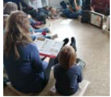
Aufmerksam hören Kleine und Große zu, als von der Segnung der Kinder durch Jesus erzählt wird

Unter dem Motto "Gott segnet dich - Du bist ein Segen" fand am Samstag, dem 17. September, ein ökumenischer Familiengottesdienst statt. Nach einem kurzen Lied zur Begrüßung und einem Kennenlernspiel wurde zunächst ausgiebig und lecker gemeinsam gefrühstückt. So konnten sich Kinder und Erwachsene gegenseitig beschnuppern und in Ruhe ankommen. Im Anschluss startete der Gottesdienst im Pfarrsaal der evangelischen Kirchengemeinde. Wir hörten und sahen die Geschichte, wie Jesus die Kinder segnet, mit einem Kamishibai - einem japanischen Bildertheater. Danach erzählten die Kinder die Geschichte nach und legten sie mit Material.