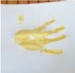
Segen ist golden – diese goldene Segenshand bastelte einer der jüngsten Teilnehmer

Spannend war es, auf welche Ideen die Kinder kommen, um Segen darzustellen. Jedes Kind bastelte mindestens ein Segensarmband, das es verschenken oder als Andenken mit nach Hause nehmen durfte. Höhepunkt war mit Sicherheit der Abschluss, als sich Kinder und Erwachsene gegenseitig segneten.